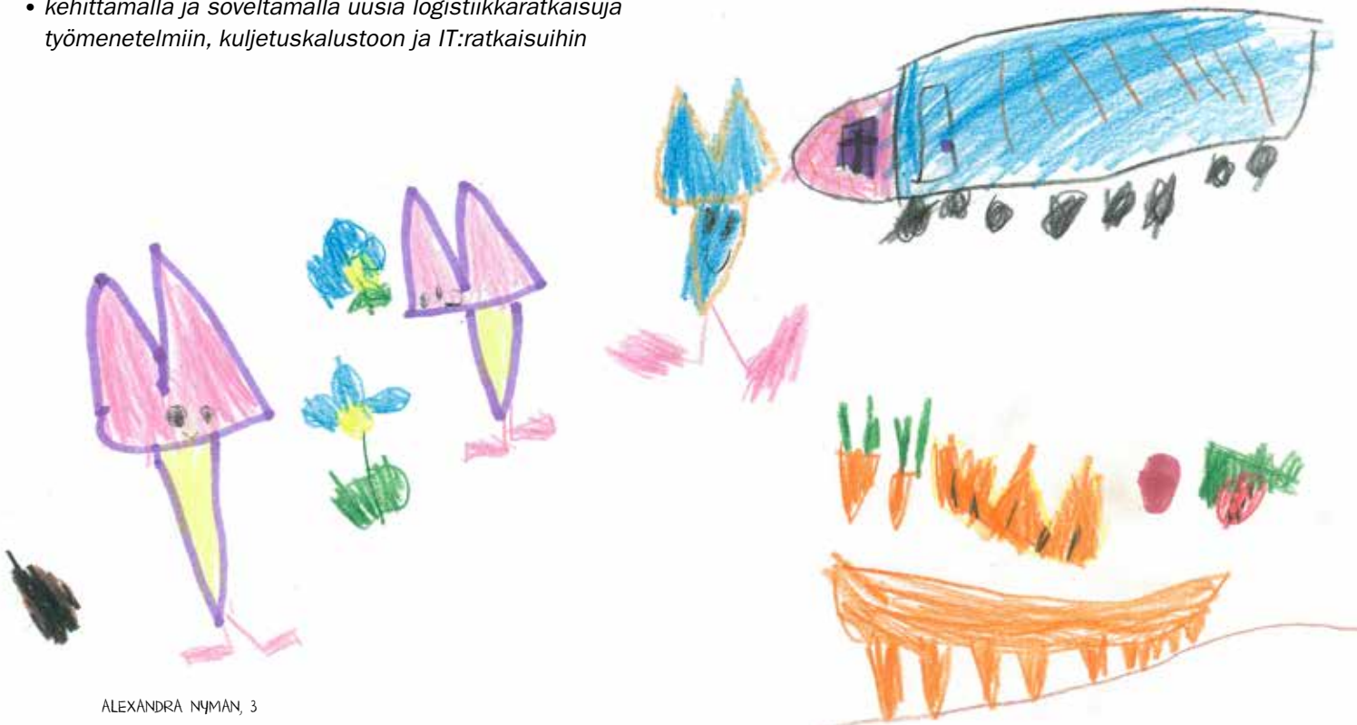
ALEXANDRA NYMAN, 3