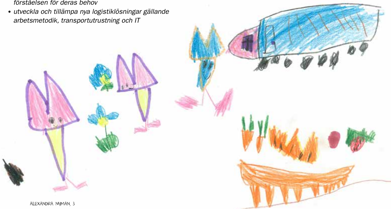
ALEXANDRA NYMÄN, 3